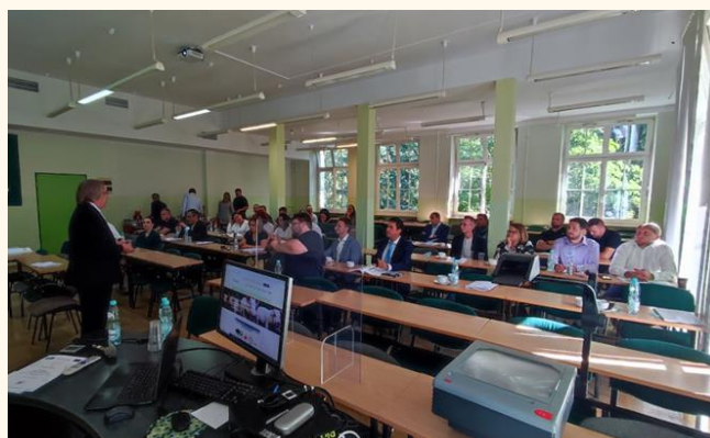
Fig. Leslokaal en publiek tijdens de training

Na enige tijd (minstens 6 maanden) werd de deelnemers gevraagd of het voor hen gemakkelijker was om de bioveiligheidsmaatregelen uit te voeren na de implementatie van de OM.