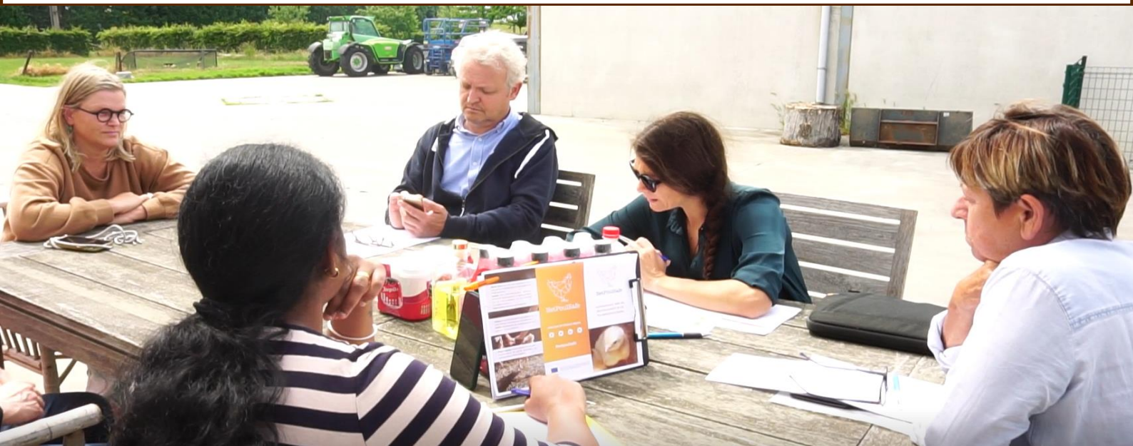
Figura 2. El Coach, el moderador, el veterinario y el ganadero de broilers en una sesión de coaching. Coaching es la medida de apoyo seleccionada para Bélgica