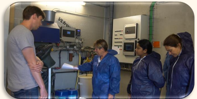
Figura 4. Evaluación inicial de la explotación y recopilación de datos antes del coaching

* El plan de acción debe ser revisado periódicamente.