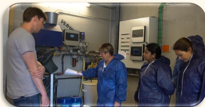
4. ábra: A gazdaság kezdeti értékelése és adatgyűjtés a coaching előtt