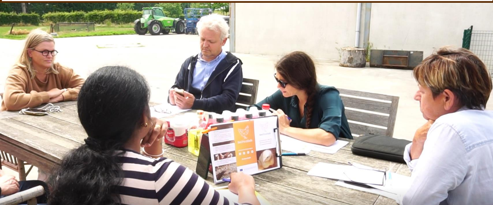
2. ábra: A coach, a támogató, az állatorvos és a brojlertenyésztő egy coaching ülésen. Belgium számára a coaching a kiválasztott támogató intézkedés